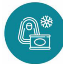
غذای منجمد و نیمه آماده