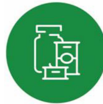
غذای کنسرو شده