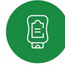
انواع سس و انواع روغن