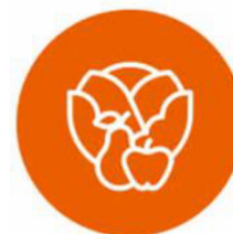
میوه جات و سبزیجات