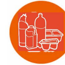
پلاستیک ، چاپ و بسته بندی