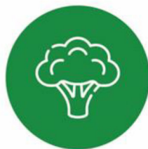
صنایع غذایی ارگانیک و طبیعی